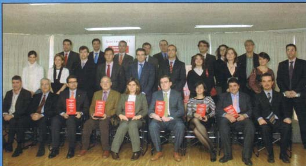
Foto de familia de los representantes de las candidaturas presentadas (seis de ellos con los trofeos obtenidos; tres por cada modalidad), después de las intervenciones de exposición de méritos.

- Gobierno de La Rioja. Participa: Portal de participación y colaboración con los ciudadanos.